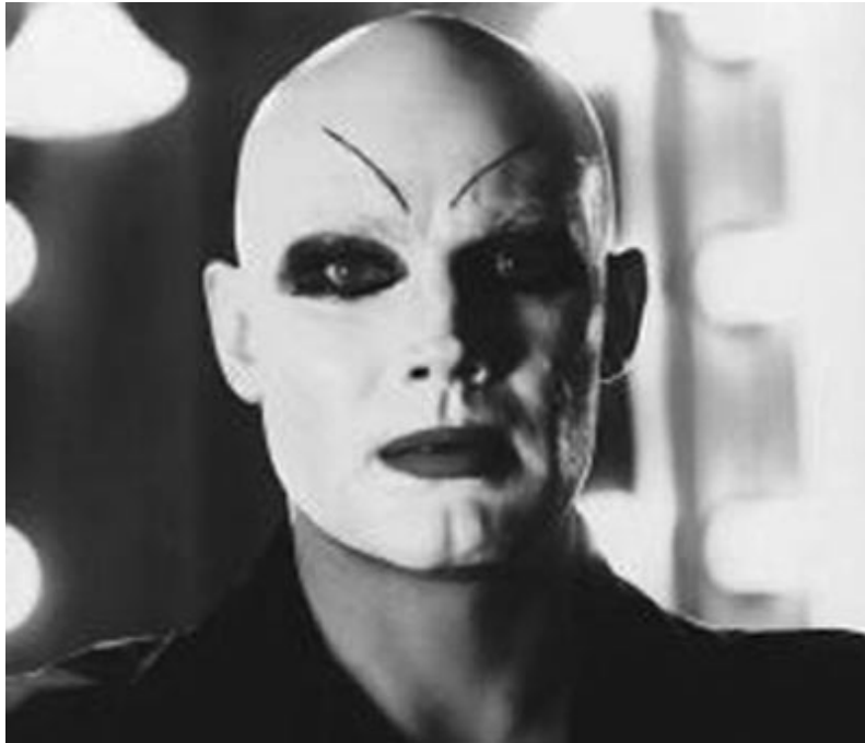
Klaus-Maria Brandauer az Oscar-díjas "Mephisto" főszerepében (1981)

Szabó hol szerelemről és forradalomról mesél (Szerelmesfilm), hol a hitleri időkről (Mephisto) is, hol pedig a roskatag, beteg Osztrák-Magyar Monarchiáról, melynek élén egy roskatag, beteg császár áll (Redl ezredes). A napfény íze című filmben pedig mindezzel egyszerre!