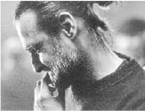
Tarr Béla (1955- )