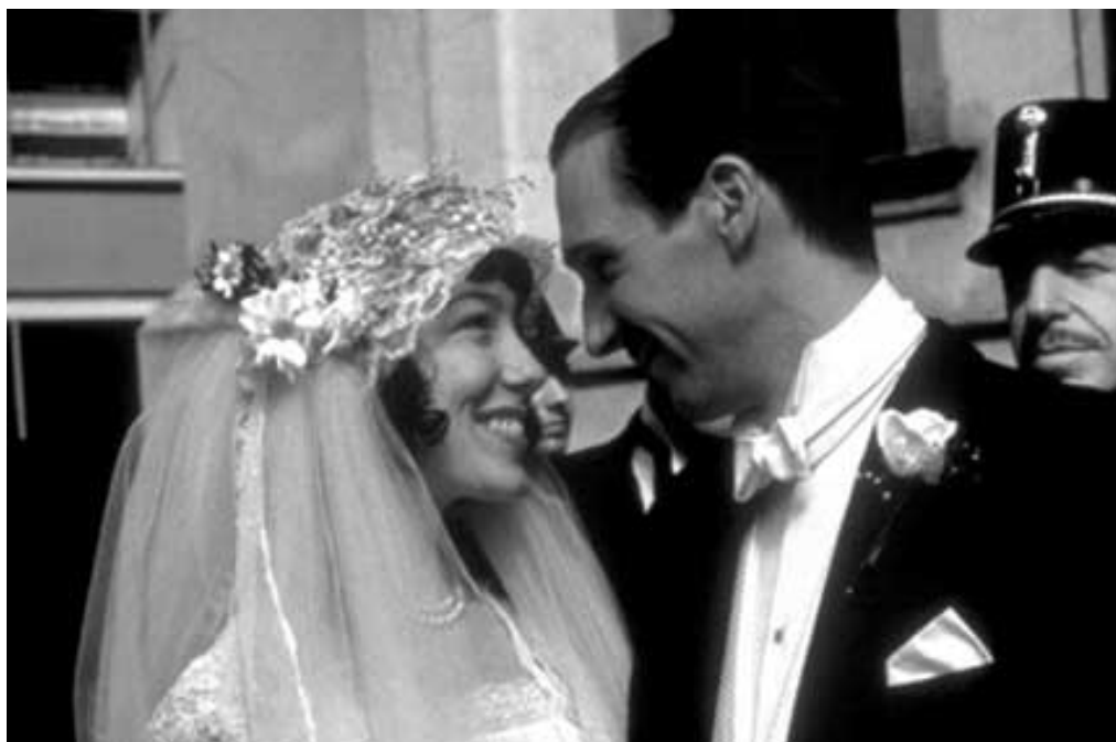
A napfény íze (1999)

He told us intriguing stories about love and revolution ( Love ), life in a shaky old Austria-Hungary with a shaky old emperor ( General Redl ), the Nazi regime ( Mephisto ) and in one of his more recent films about all these issues together ( Sunshine ).