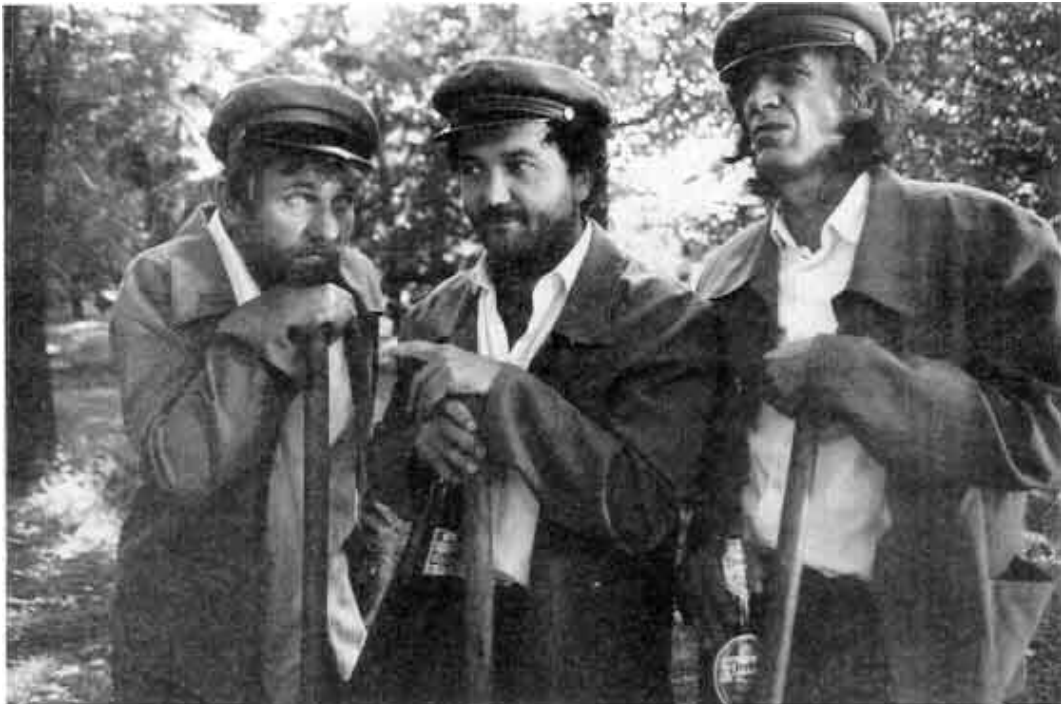
Nekem lámpást adott kezembe az Úr Pesten (1999)

Jancsó sokoldalú filmrendező, akit hol az egyén és a hatalom viszonya érdekel ( Csillagosok, katonák ), hol pedig az asztrológiában való jártasságáról tesz tanúságot ( Jézus Krisztus horoszkópja ). Egyik filmjében a budapesti szúnyogproblémával is behatóan foglalkozik ( Anyád! A szúnyogok ).