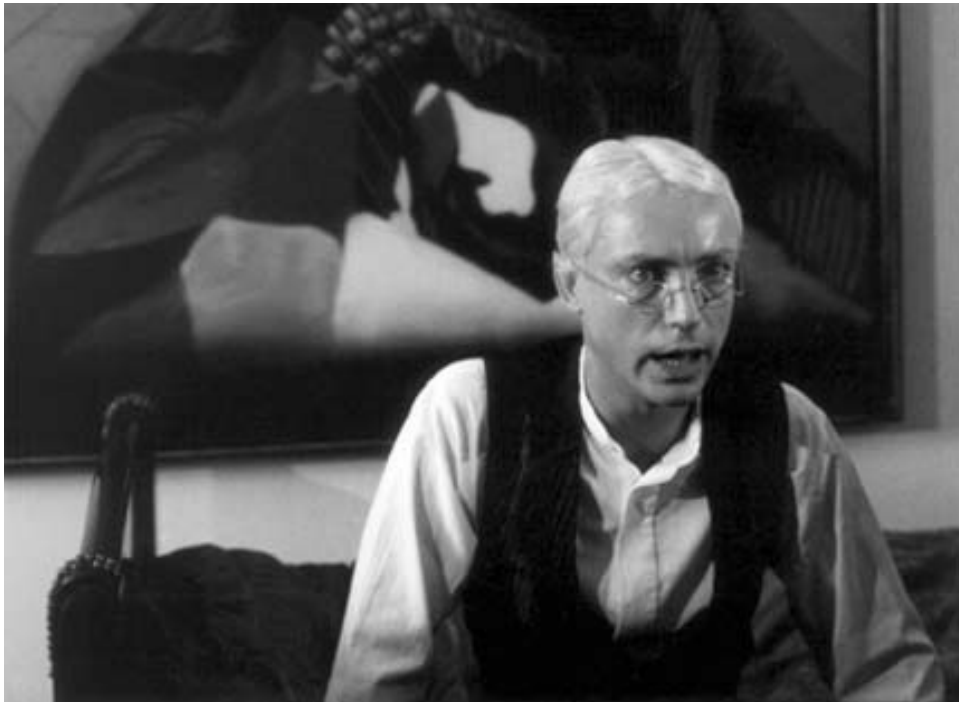
...s még egyszer a fiatal Udo Kier mint Nárcisz (1980)