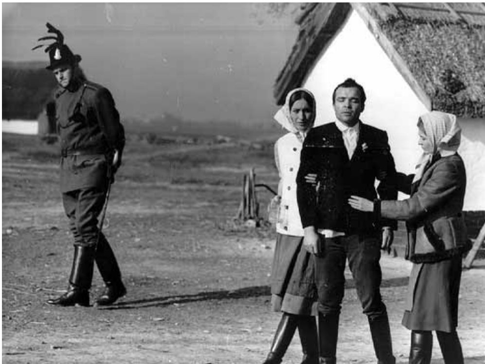
Jelenet Jancsó Miklós "Csend és kiáltás" c. filmjéből (1967)

Az ötvenes évek végén Makk egyik kollégájával megkezdődött a tankok, pucér nők és szokatlanul hosszú képsorok kora. A meglepő témaválasztásért és az új filmnyelvért Jancsó Miklós a felelős.