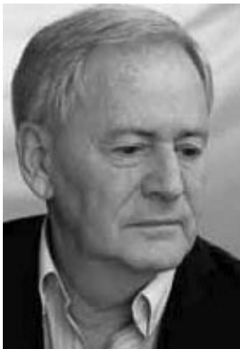
István Szabó (1938- )

For those who were not really interested in surrealistic scenes and slow-moving cameras even if scarcely dressed women were involved, István Szabó offered an alternative. He showed us that nothing was as simple as it seemed.