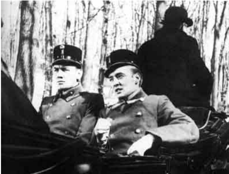
Jelenet az Osztrák-Magyar Monarchia idejében játszódó "Redl ezredes" c. filmből(1985)

Azoknak, akiket nem érdekeltek a szürrealista jelenetek és a lassan mozgó kamerák (még ha lengén öltözött hölgyek álltak is előtte), Szabó István kínált alternatívát. Az ő filmjeiből az derült ki, hogy semmi nem olyan egyszerű, mint amilyennek látszik.