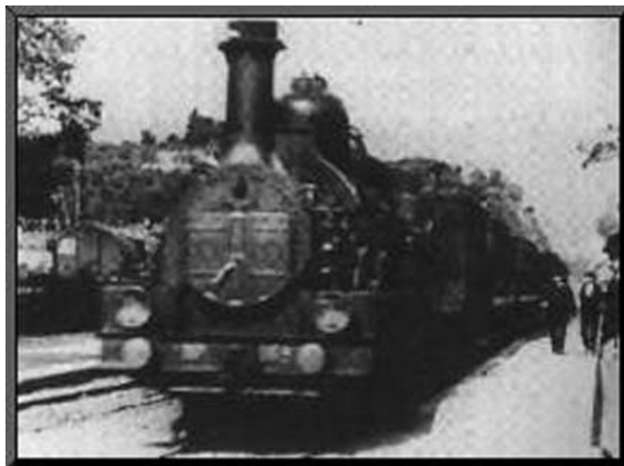
A vonat megérkezik La Ciotat állomására (1896)

Több mint száz évvel ezelőtt ez a két férfi fedezte fel a mozgóképet. De vajon miért azt filmezték először, ahogyan a vonat befut La Ciotat állomására? Senki nem tudja.