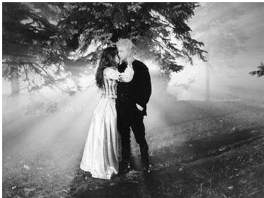
Udo Kier Nárcisz, Patricia Adriani Psyché szerepében (1980)