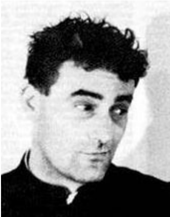
Bódy Gábor (1946-1985)

Then one of our filmmakers discovered that very short stories were enough to make very long films. Gábor Bódy also realised that the dialogues did not need to be always written in prose just because we, ordinary people, don't like talking in rhymes...