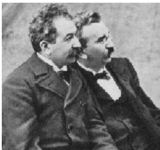
Auguste (1862-1954) és Louis Lumière (1864-1948)

More than hundred years ago, these two men invented the moving picture. But why on earth did they chose the arrival a train in the tiny city of La Ciotat as a topic for their first mini-film? Nobody knew.