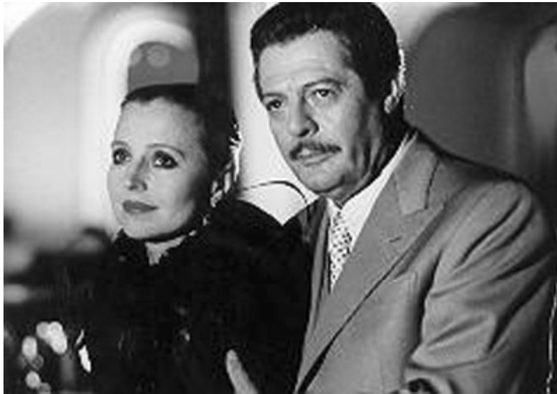
Ez már nem a foci: jelenet a "Miss Arizona" c. filmből Hanna Schygullával és Marcello Mastroiannival (1988)