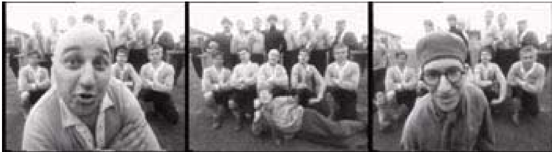
Képek a "Régi idők focija" című filmből (1981)